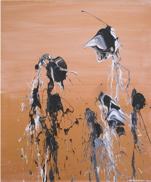
Elämän fantasia - ensimmäinen näytös

Katsoessaan abstrakteja teoksia katsoja tulkitsee itseään sisältä. Taiteilijan abstrakti ekspressio muuttuu katsojan abstraktiksi impressioksi.