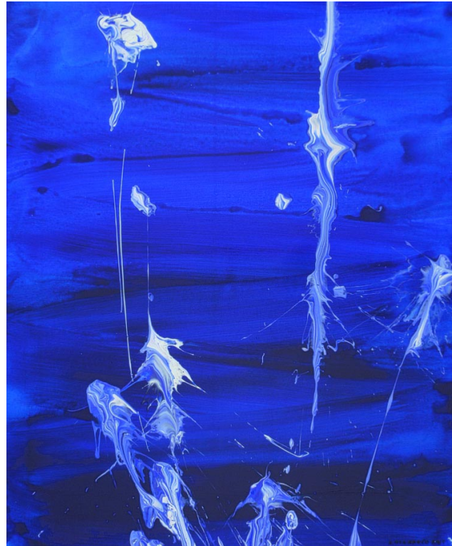
Alkumeri elää 1