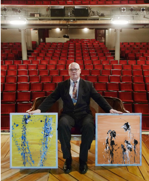
Teokset: Avaruusvirrat (=Koloratuuri) ja Elämän fantasia - ensimmäinen näytös